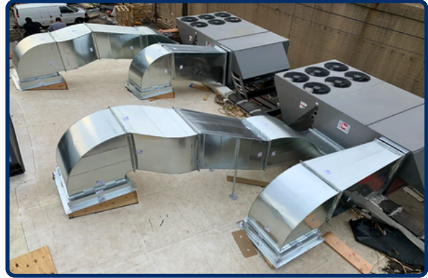
Trane RTU & Duct System KSA