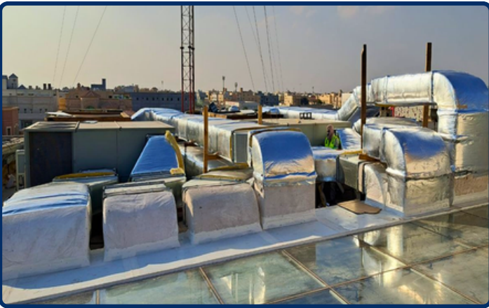
Pre-Insulated Ductwork — Rooftop Commercial Sector, KSA