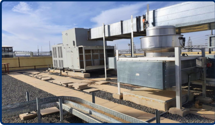
Rooftop HVAC Installation Eastern Province, KSA