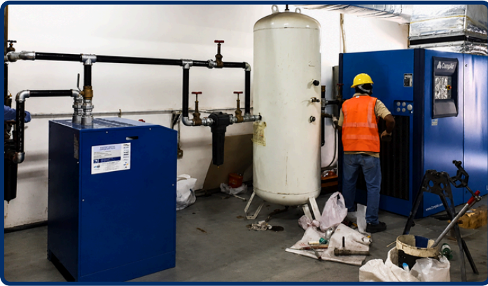
Compressor install and piping commissioning