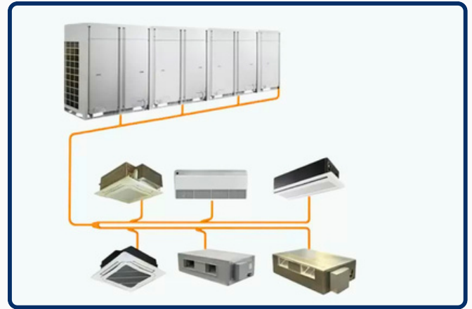
VRF System Industrial Facility, KSA